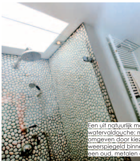
Een uit natuurlijk materialen gebouwde watervaldouche: met bovenlicht, omgeven door kiezelstenen, en dit alles weerspiegeld binnen de omlijsting van een oud, metalen advertentieboard.