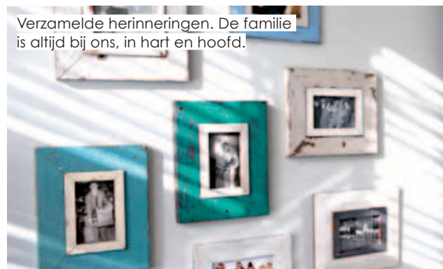
Verzamelde herinneringen. De familie is altijd bij ons, in hart en hoofd.