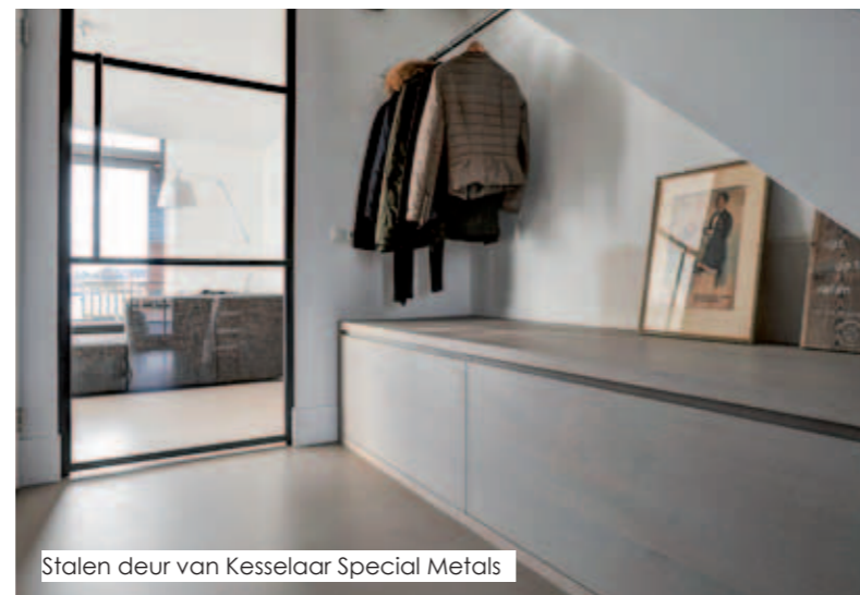
Stalen deur van Kesselaar Special Metals

HET IS HUN EERSTE HUIS SAMEN. BEWUST HEBBEN ZE GEWACHT TOT DE TWEE KINDEREN VAN HAAR EN DE DRIE VAN HEM 'AFTRAPTEN MET HUN STUDIE'. DOOR DE WEEK WONEN ZE ER MET HOND BOOMER, MAAR IN HET WEEKEND ZIJN ER ALTIJD WEL EEN PAAR KINDEREN DIE KOMEN 'UITBRAKKEN'.