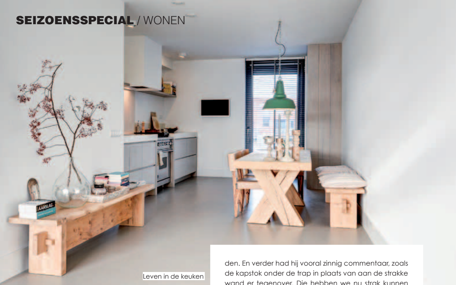
Leven in de keuken