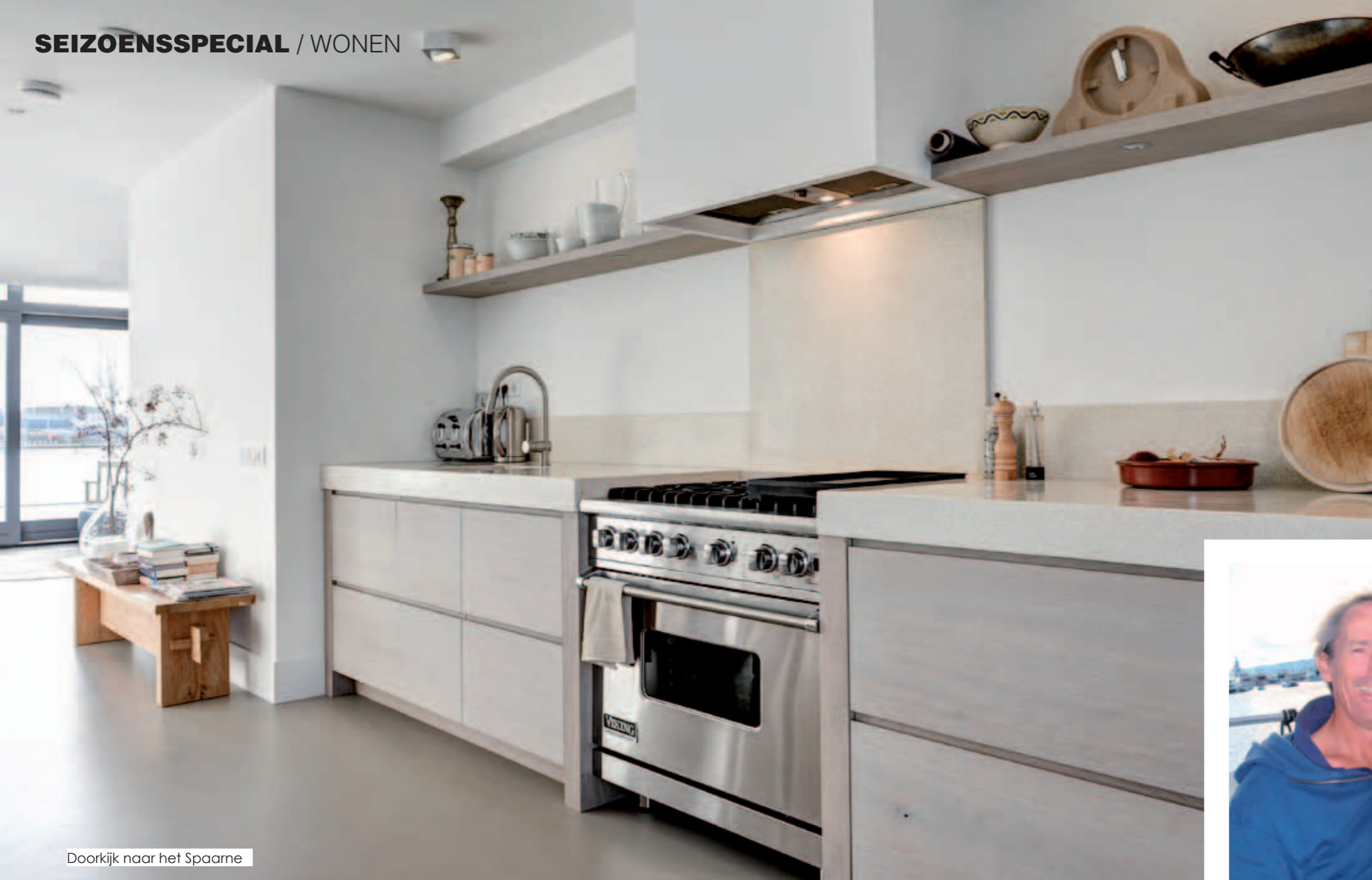
Doorkijk naar het Spaarne